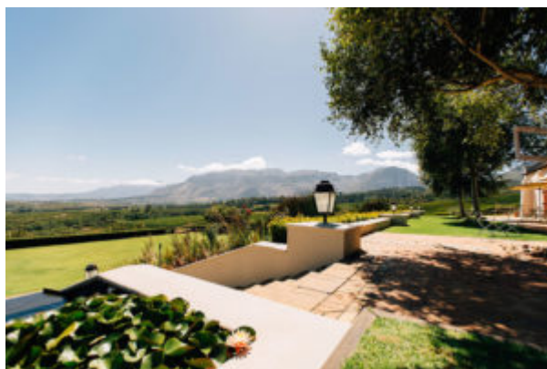
Egendomen Ernie Els Wines